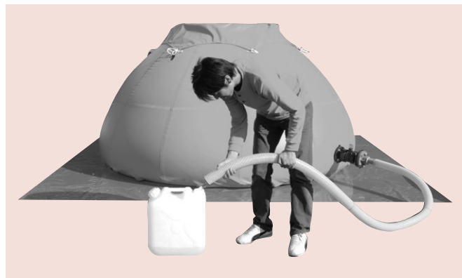
注水ホースでポリタンクに給水中