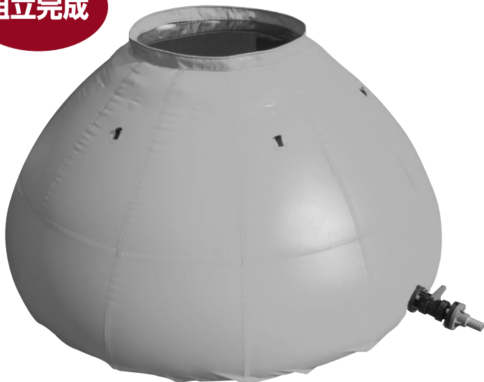
※この説明書はウォータータンク5000Lを用いて説明しています